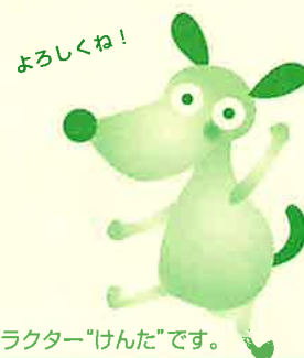
法人会オリジナルキャラクター「けんた」です。

※今治法人会ホームページ インターネットアドレス https://hojinkai.zenokuhojinkai.or.jp/imabari/